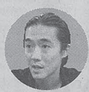
ジンス・ユン 副社長

仮想空間「セカンドライフ」を運営する米リンデンラボのジンス・ユン副社長は十六日、日本経済新聞